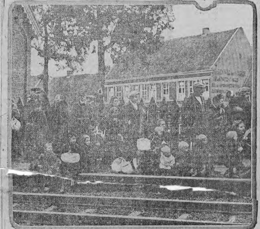
BELGIAN REFUGEES

Fugitivos belgas esperando un tren que los conduzca a Holanda y que por lo tanto los ponga a salvo del peligro